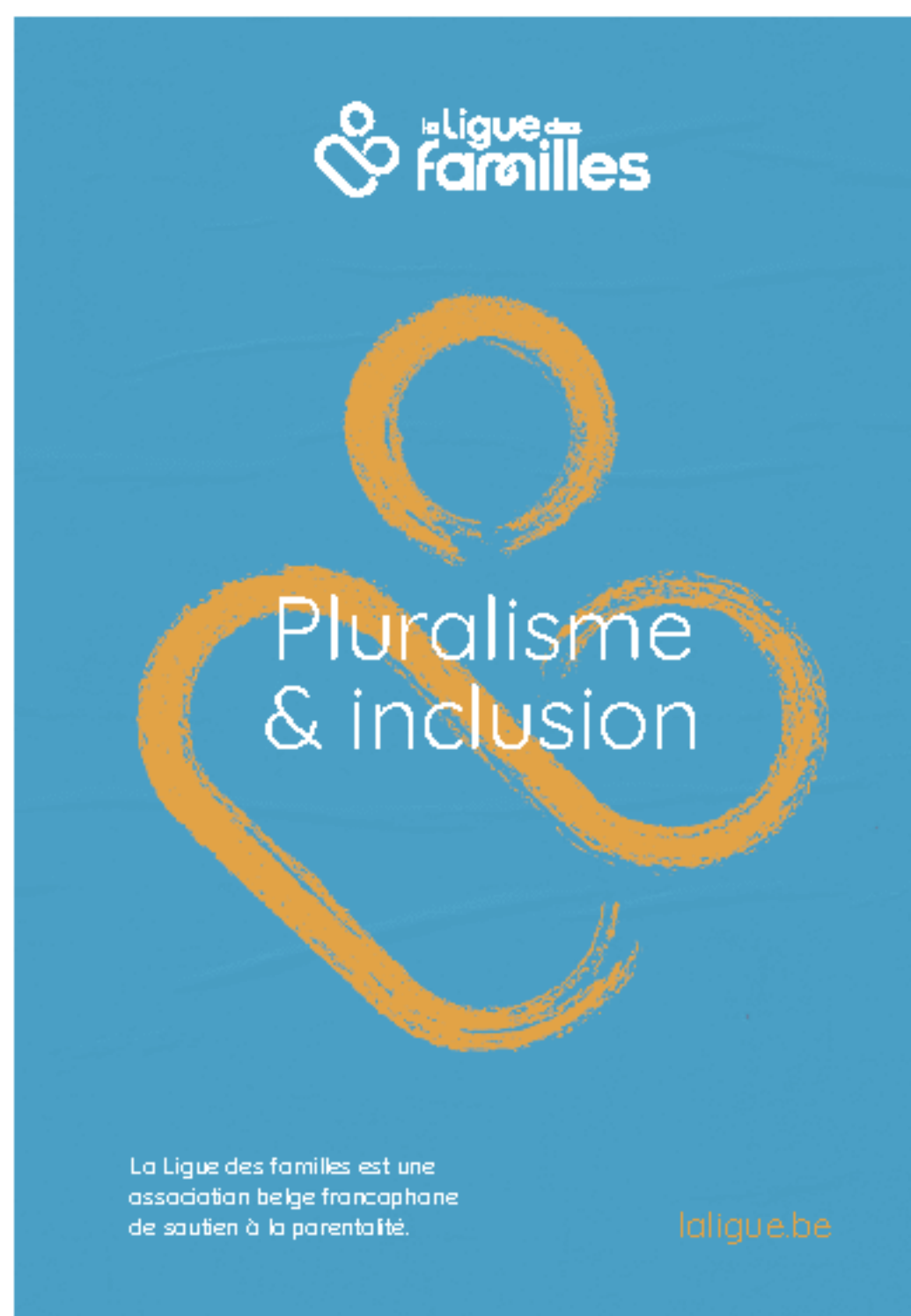
Fond de couleur + symbole de couleur